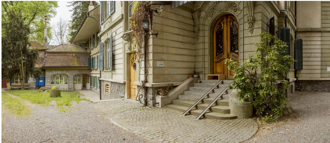
Eingang Liegenschaft Muristrasse 28

Bei beidseitigem Einverständnis, inkl. dem Einverständnis zu Konzept, Zielen und BeWo-Regeln sowie vorliegender Kostengutsprache wird der Betreuungsvertrag unterschrieben und der Eintritt konkret geplant.