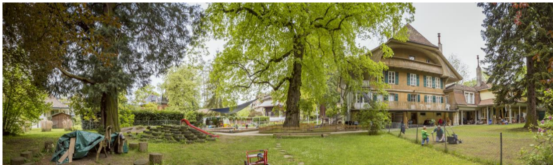
Garten der Liegenschaft Muristrasse 28

In dem historischen Gebäude an der Muristrasse 28 gibt es bis zu drei Plätze Betreutes Wohnen sowie fünf Therapieplätze. Die Plätze eignen sich besonders für Klient:innen, die Eltern sind. Der parkähnliche Garten verfügt über altersgerechte Spielgeräte, falls Kinder zu Besuch kommen. Im gleichen Gebäude und im Chalet auf dem Gelände befindet sich die stiftungseigene Kita Zazabu.