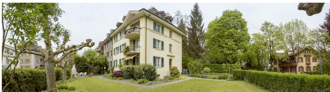
Liegenschaft Muristrasse 36

In der Muristrasse 36 befinden sich vier Wohneinheiten. In den Wohnungen leben die Klient:innen zu dritt zusammen. Jede Wohnung verfügt neben den Einzelzimmern für die Klient:innen über ein Bad, eine separate Toilette, eine Wohn-Essküche und einen Wohnbereich. Zum Haus gehört ein grosser Garten mit Grillstelle und Tischtennisplatte.