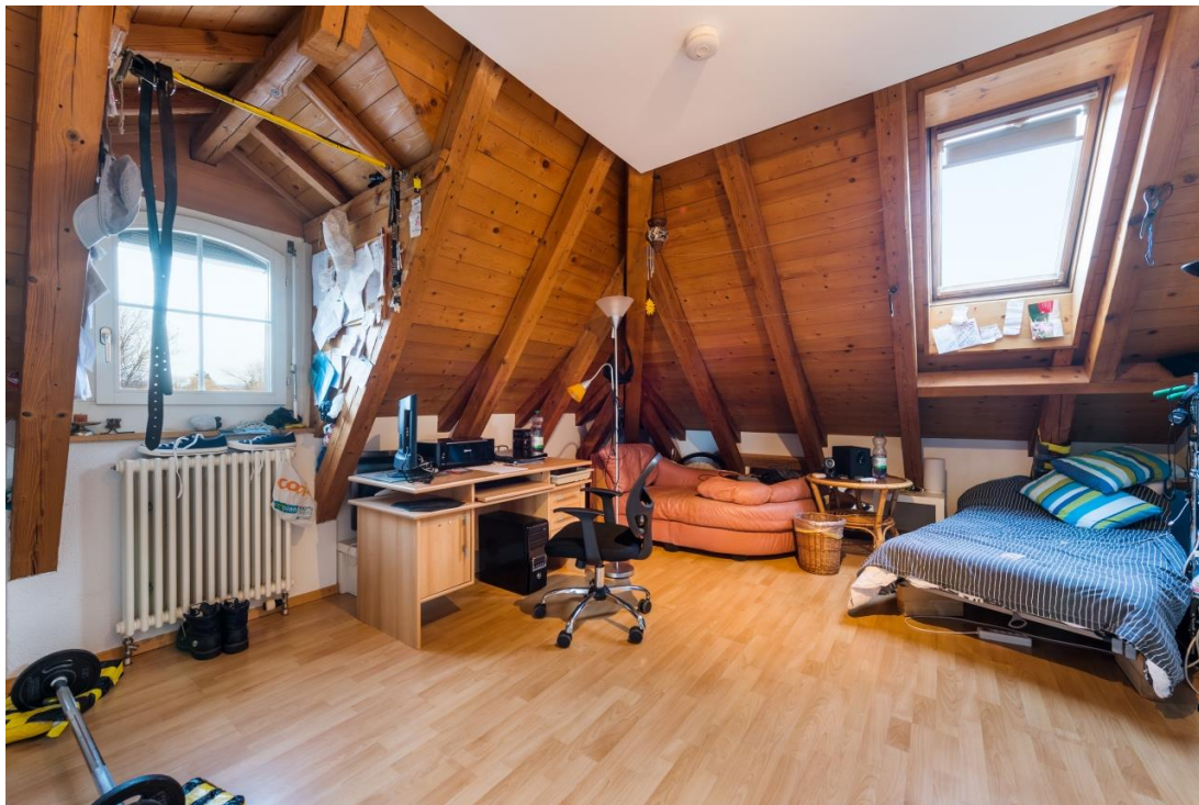
Beispiel Zimmer Muristrasse 36

Die grosszügigen Zimmer im Betreuten Wohnen sind mehrheitlich möbliert, einzelne Zimmer können unmöbliert bezogen werden. Jedes Zimmer verfügt über einen eigenen Tresor zur Aufbewahrung persönlicher Wertgegenstände und der Medikamente.