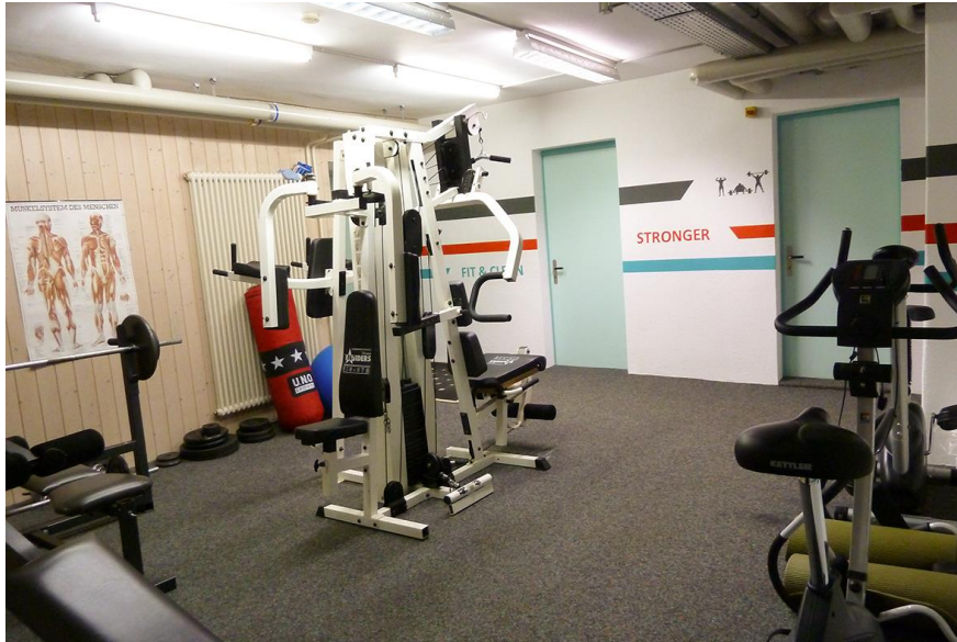
Fitnessraum Muristrasse 37

Besuchende sind willkommen (siehe gesonderte Regelungen für Besuchende). Freizeitaktivitäten, die im Rahmen der Sozialtherapie durchgeführt werden, können von den BeWo Klient:innen bei freien Plätzen genutzt werden (z.B. Skilager, Ferientage im Sommer/Herbst oder regelmässige Wochenendaktivitäten). Auch eine Teilnahme an weiteren Projekten, wie der Mithilfe auf einer Alp, ist möglich.